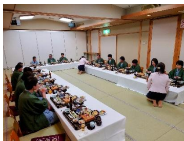
忘年会で交流を深めます