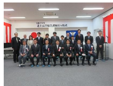
職業訓練校でスキルアップ