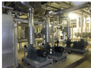
設備機械の設置工事、配管工事

住宅から学校、病院、店舗まで幅広い分野の冷暖房、給排水設備について設計、施工、メンテナンスを行っています。