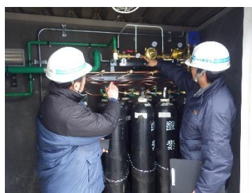
メンテナンス業務