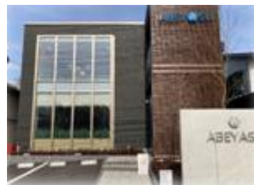
北上市初ゼロエネルギー ビルディング