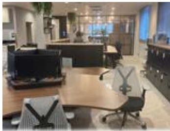
オープンなコミュニケーション空間