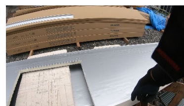
〔切断加工をした金属板〕

地元北上市を中心に、建設工事現場にて、薄い金属板を屋根や壁に取り付ける作業、またそれに伴う板金加工を行います。鋼板は工場にて成型加工し、細かい端部調整は現場で行います。