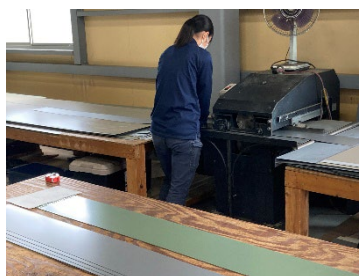
〔金属板切断加工中の写真〕