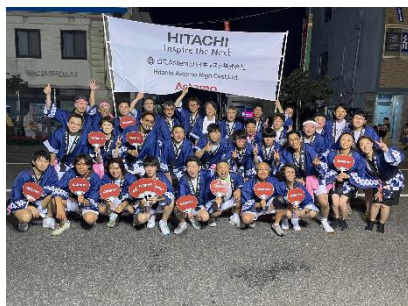
北上・みちのく芸能まつり

お花見、工場対抗野球交流試合、工業団地野球大会、北上・みちのく芸能まつりへの参加など、各種行事があります。