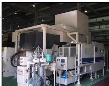
ダイカスト鋳造設備(800ton)

当社では、自動車用エンジン機器やブレーキ製品の部品を世に送り出すとともに、オイルポンプ・ウォーターポンプ等の加工組立品も生産しています。