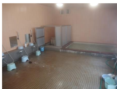
いつでも使える社内の浴場