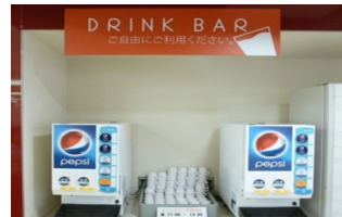
無料ドリンクバー

○育児休暇や介護休暇は女性のみならず男性の取得も増えてきており、働きやすい職場作りに努めております。