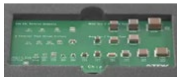
各種形状の製品を製造

積層セラミックチップコンデンサは自動車やスマートフォンなど多くの製品に用いられている電子部品です。