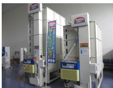
当社製品：粳の乾燥機