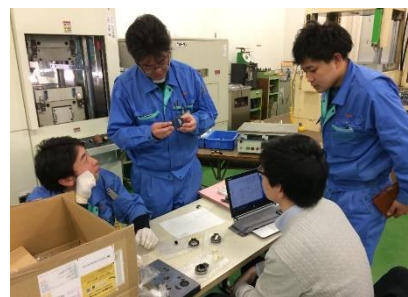
仕事は「仲良く愉快地」!