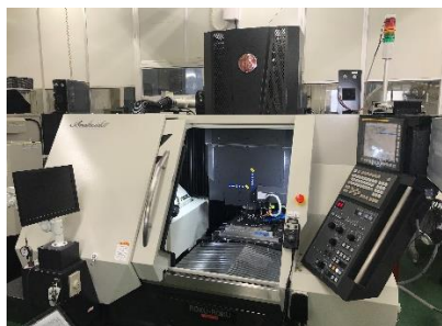
最新鋭の加工マシン