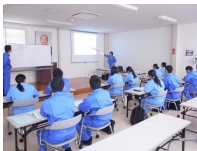
ゼロから学べる新入社員研修

そのために、ゼロから一つ一つ行う社員教育を行っています。「仲良く愉快地」働く文化がしっかり根付いた職場です。