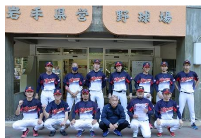
野球部試合後の一枚