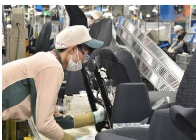
自動車シートの組付け