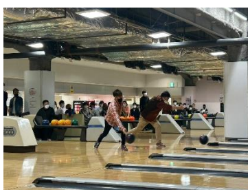
ハイスコアを競います！

毎年新入社員を迎え行う「ボウリング大会」や、模擬店やイベントを楽しめる「秋祭り」を開催しており、社員同士が交流する機会が多い職場です。他にも野球部や卓球部といった部活動、赤い羽根募金や宮城県大衡村にある森林の整備といったボランティア活動も積極的に行っています。