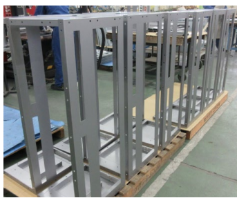
様々な機器の筐体製造

半導体、通信、医療、環境等の様々な機械製品を、精密プレスから金属加工、塗装処理、完成組立までの一貫した生産ラインで生産しています。