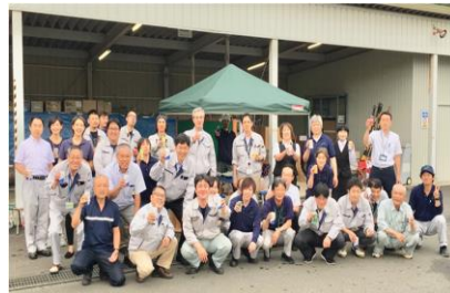
みんなでわいわい BBQ 大会