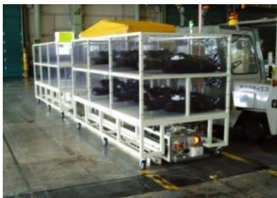
自動搬送車製作、電気制御