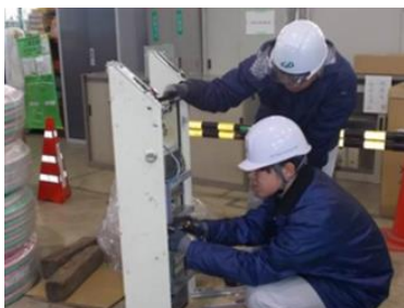
回路図をもとに盤内配線作業