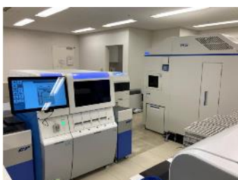
検体検査自動化システム