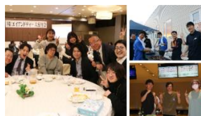
社内イベントの様子 (忘年会、BBQ、ホーリング大会)