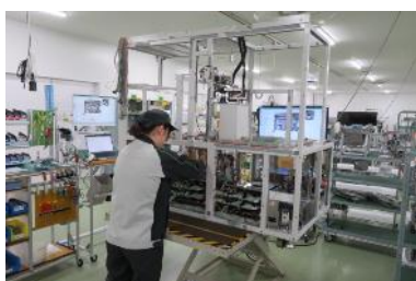
本体組立の作業風景