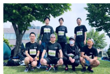
きらめきマラソンに参加