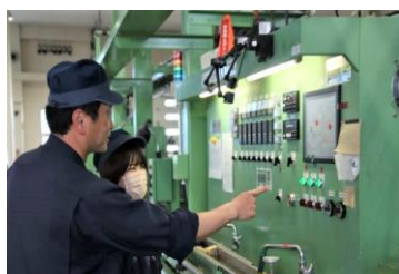
先輩社員による熱心指導

新入社員に対して、先輩社員が優しく、丁寧に指導しています。安心して仕事を覚えることが出来ます。有給消化率も高く、プライベートも充実出来ます。毎年、マラソン大会への参加もしています。