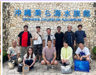
社員旅行（@沖縄） ※創業 60 年記念行事