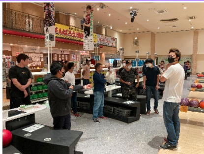
暑気払い（ボーリング大会）