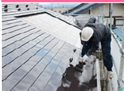
戸建て塗装の様子