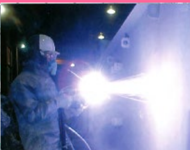
橋梁での金属溶射工事