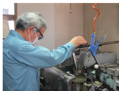
高い技術による加工