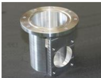
部品例（丸と角の複合形状）

金属や樹脂を原材料とした精密機械部品加工をしています。材料の削りだしのほかに、注文に応じた治工具の設計と製作も行っています。