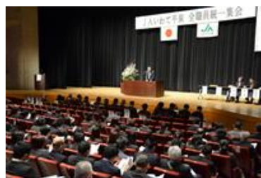
事業方針等を共有・確認 〔全職員統一集会〕

毎年、「全職員統一集会」を開催し、事業方針等を共有することにより職員一丸となり躍進していくことを確認しています。また、地域の農業イベント・お祭り等に参画し、地域住民とのコミュニケーションを深めております。