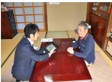
お役立ち情報を提供 〔ライフアドバイザー〕