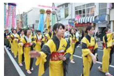
一関夏まつりに参加 〔くるくるパレード〕