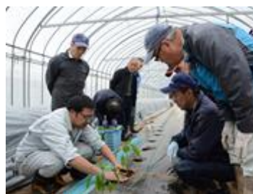
ピーマンの苗を定植 〔営農指導〕

地域の皆様が豊かで快適な生活を送るお手伝いをするため、さまざまなサービス(営農・購買・販売・信用・共済事業等)を提供しております。