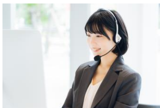
コンタクトセンタースタッフ