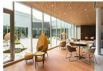
リラックスエリア