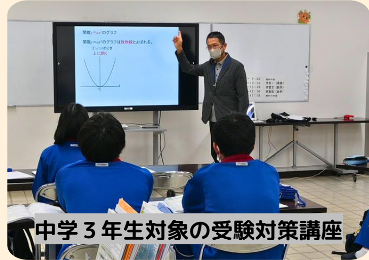
中学3年生対象の受験対策講座