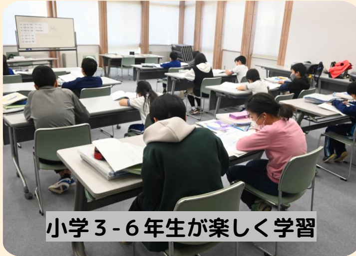
小学3-6年生が楽しく学習