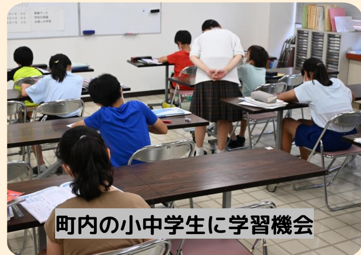
町内の小中学生に学習機会