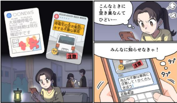
総務省「インターネットトラブル事例集」(2025年度版)より