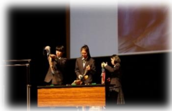
( 宮古恵風支援学校の皆さん )

宮古恵風支援学校は、小学部、中学部、高等部の全ての学部で復興教育に取り組んだことを発表し、冬の風物詩「新巻鮭」の作り方をわかりやすく発表しました。