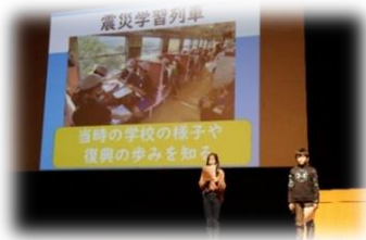
( 山田小学校の皆さん )

山田小学校は、復興教育の3つの柱、震災学習列車の活用、青山小学校との交流活動を通して学んだことについて発表しました。