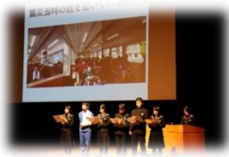
( 釜石中学校の皆さん )

山田小学校は、復興教育の3つの柱、震災学習列車の活用、青山小学校との交流活動を通して学んだことについて発表しました。