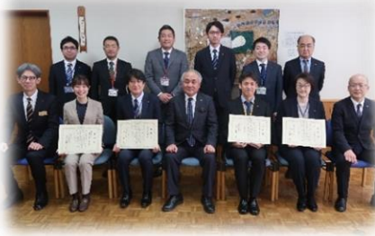
( 表彰受賞者の皆さん )