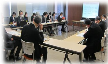
( 連携会議の様子 )

いわて幼児教育センター事業の実施報告と次年度計画の説明、保育者の研修を推進する「岩手県保育者のための学びのらしんばん活用ガイド」等刊行物の紹介を行ったほか、保育の質の向上を図るため取り組むべきこと(研修の機会の保障、人材育成等)について協議しました。