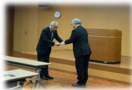
(諮問書を手交する様子)

審議の結果、無形民俗文化財「盛岡八幡宮祭りの山車行事」と「山田の神幸行事」の2件が新たに岩手県指定文化財とすることとして答申されました。