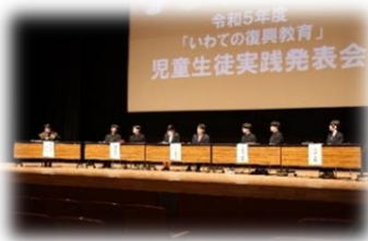
( 高校生のパネルディスカッション )

パネルディスカッションでは、大迫高校・金ヶ崎高校・大船渡高校・岩泉高校が、「復興教育を通じて自分が変化したこと」、「他校の取り組みに対して感じたこと」、「今後の学び」について考え、自分たちの言葉で発表しました。