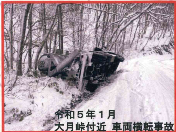
令和5年1月 大月峠付近 車両横転事故