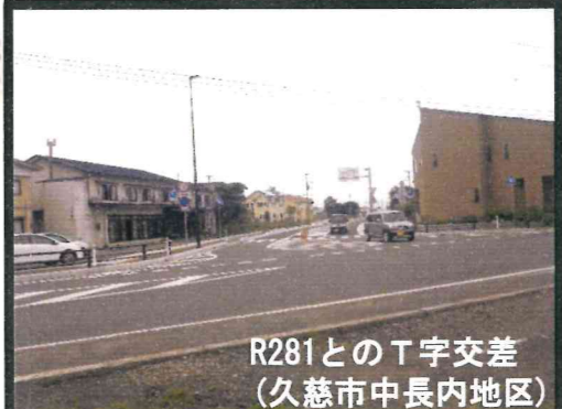
R281とのT字交差 (久慈市中長内地区)