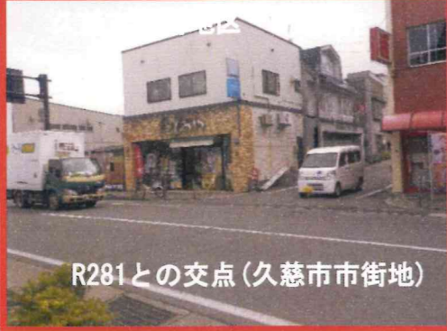
R281との交点 (久慈市市街地)