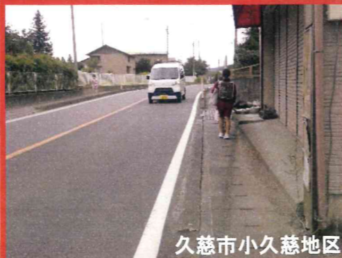
久慈市小久慈地区