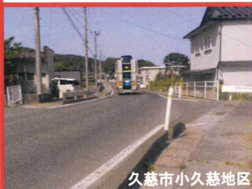
久慈市小久慈地区