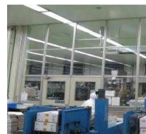
空気を經由した汚染を防止する設備（パーティション）の導入