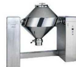
製造ラインにおいて添加物混入を回避する輸出専用ミキサーの導入