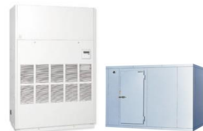
厳密な温度管理に対応する急速冷凍庫等の導入