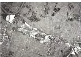
昭和43年 開港当初(1,200m滑走路)