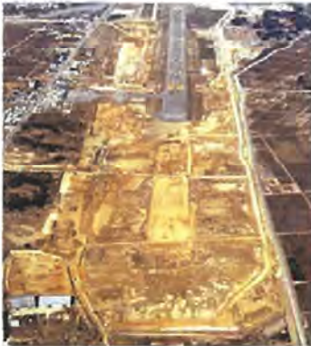
昭和56年 1,200mで暫定共用中の 2,000m滑走路工事