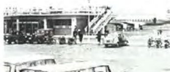
昭和39年開 開港当時の花巻空港