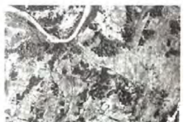
昭和22年 空港建設前