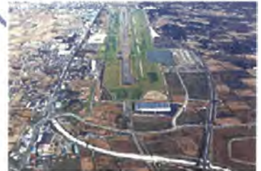
平成16年 滑走路延長部完成