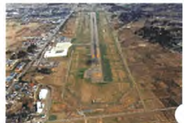
平成9年 滑走路2,500m整備 事業着手前の2,000m滑走路