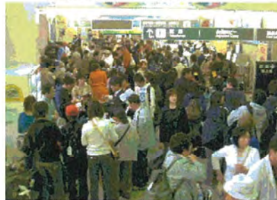
混雑するロビーの様子