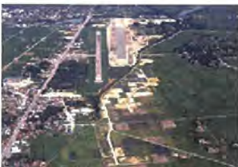
昭和55年 1,200mの滑走路と 建設中の2,000m滑走路