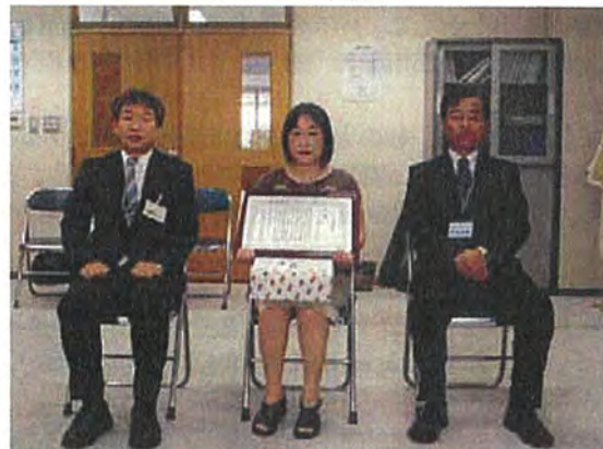
杜の大橋名称選考表彰式