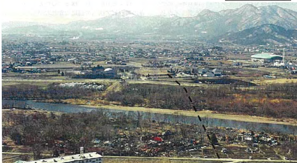
事業着手前(破線は、橋の位置)