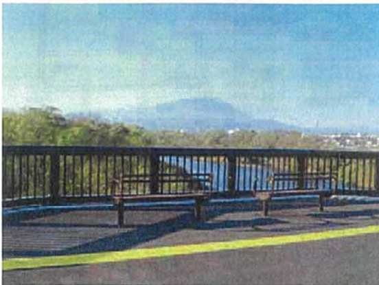
バルコニーから岩手山を望む