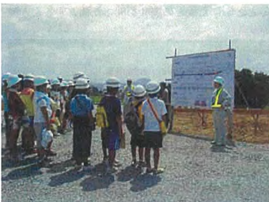
本宮小学校見学会