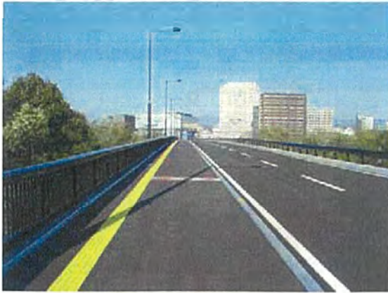
本宮側から盛岡駅西口方面