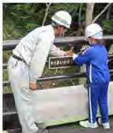
橋名板を児童の手で橋梁に取付