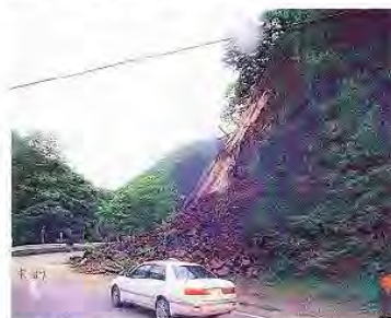
H15.5.26 南三陸地震による法面崩壊