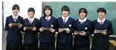
記念の銘板レプリカを手にする生徒の皆さん