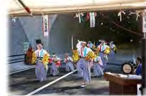
郷土芸能「大股神楽」