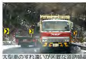
大型車のすれ違いが困難な道路幅員