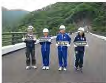
出来上がった橋名板を手にする児童の皆さん

橋名板とトンネル銘板の名前の揮毫は、地元小学校・中学校の児童・生徒の皆さんに書いて頂きました。橋名板は揮毫した児童の皆さんを現場に招待し、取り付けしてもらいました。また、トンネル銘板を揮毫した生徒の皆さんには、1/15（縦4cm×横20cm）サイズの銘板レプリカを製作し、記念として贈りました。