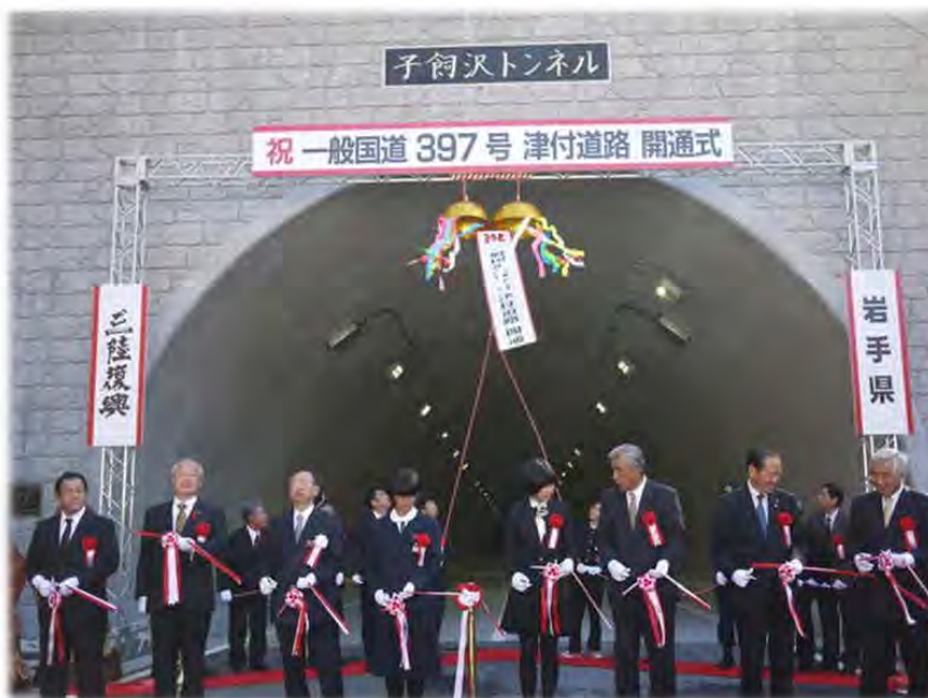
テープカット・くす玉開披

その後、午後3時から一般通行を開始し、開通を心待ちにされていた地元の皆様など多くの方々が新しい道路の開通を喜んでいました。