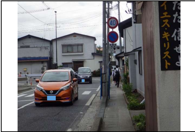
通勤・通学時の状況