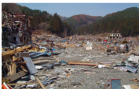
震災後の様子(片岸地区)