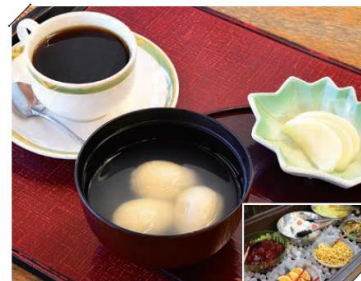
道の駅「遠野風の丘」