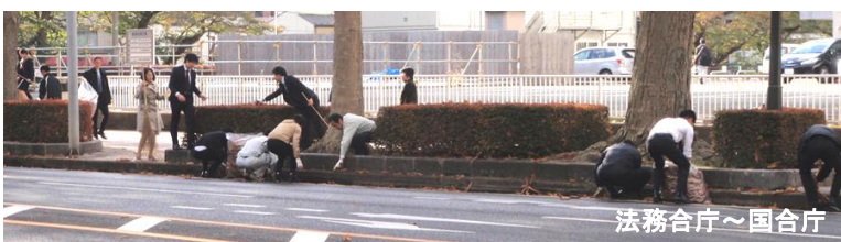
法務合同庁舎～国合同庁舎