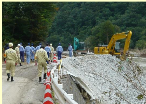
国道 455 号の被災状況