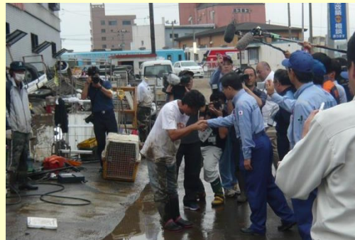
冠水した久慈駅前