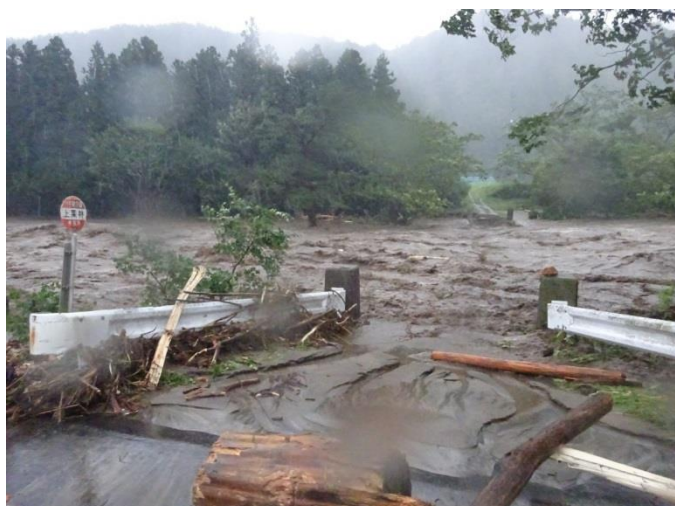
鵜住居川の氾濫により流出した市道上栗林橋(8月30日時点)

なお、道路の通行規制状況等の情報については、岩手県道路情報提供サービス ( http://www.douro.com/ ) でご覧いただくことができます。