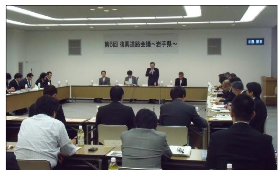
【第6回復興道路会議の開催状況】

県・市町村の事例発表では、 県内各地で進む新たなまちづくりや地域振興策は復興道路等の完成を前提 としており、 早期の全線開通が被災地の復興と未来に必要な不可欠 であるとの意見が述べられました。