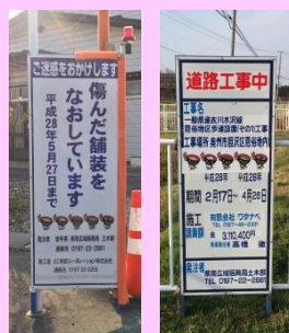
工事用看板使用例

工事現場において、国体マスコット付きの工事看板を使用し、国体開催への機運醸成、建設業のイメージアップを図ります。