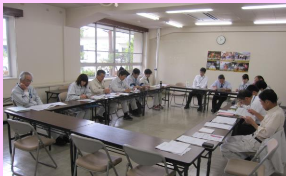
H28.5.26 第1回プロジェクトチーム会議

今後、当チームメンバーを中心に事業をすすめ、希望郷いわて国体・希望郷いわて大会を盛り上げていきます。