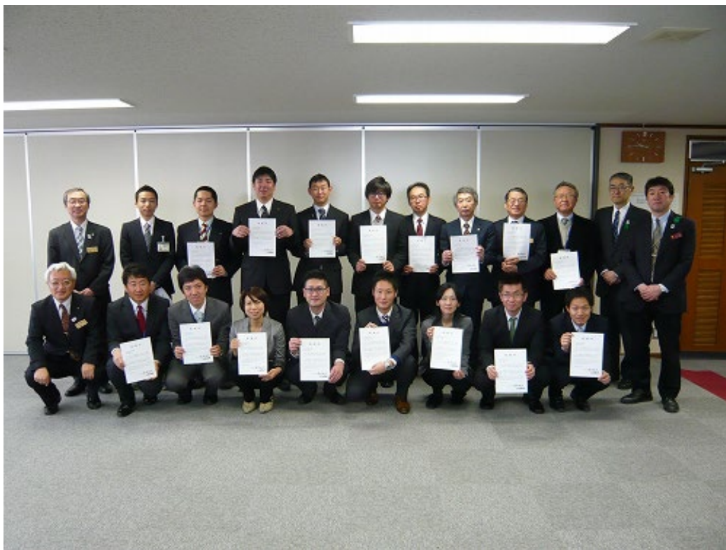
県庁での感謝贈呈式の様子