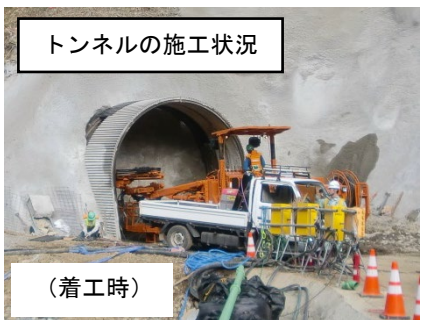
トンネルの施工状況

工事はこれまで、平成27年5月15日（金）の「安全祈願祭・起工式」以降、仮排水路トンネルの掘削を進め、9月22日（火）にはトンネルが貫通しました。その後は、コンクリートによるトンネル内部の補強工事や呑口部・吐口部の構造物建設を行い、無事にこの日を迎えることができました。