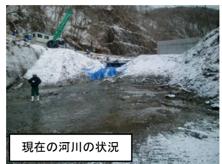
現在の河川の状況

工事はこれまで、平成27年5月15日（金）の「安全祈願祭・起工式」以降、仮排水路トンネルの掘削を進め、9月22日（火）にはトンネルが貫通しました。その後は、コンクリートによるトンネル内部の補強工事や呑口部・吐口部の構造物建設を行い、無事にこの日を迎えることができました。