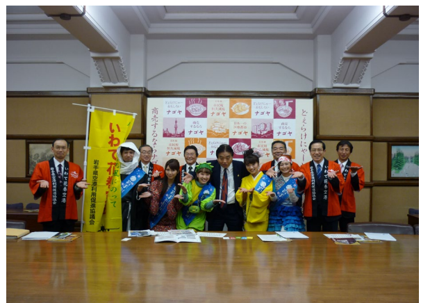
河村たかし名古屋市長との記念撮影の様子