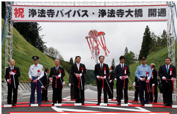
「浄法寺バイパス」テープカット及びくす玉開披