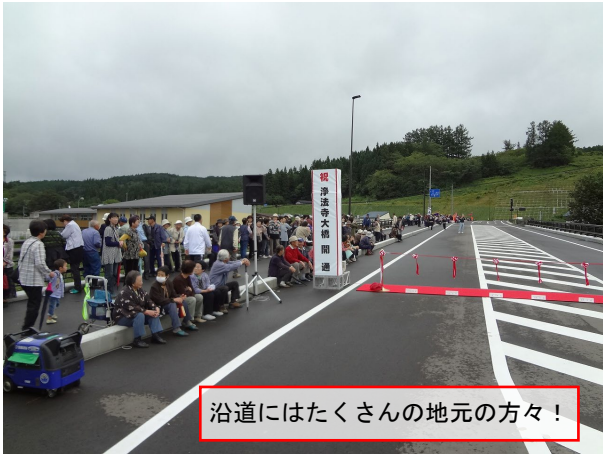
沿道にはたくさんの地元の方々！