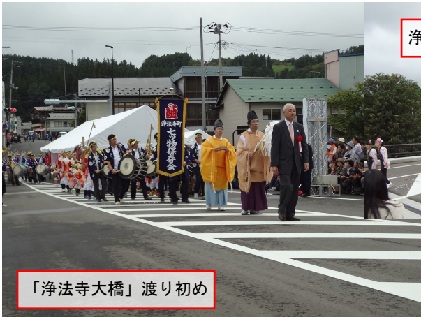
「浄法寺大橋」渡り初め