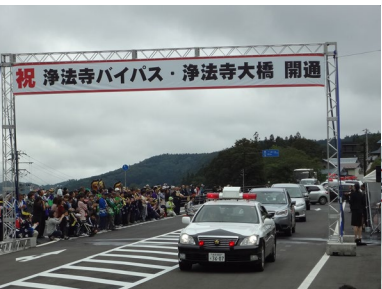
「浄法寺バイパス」パレード