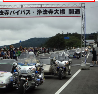
二輪車愛好家団体の参加も