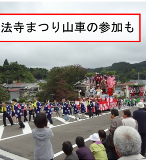
浄法寺まつり山車の参加も