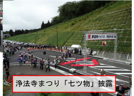
浄法寺まつり「七ツ物」披露