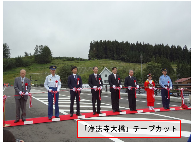
「浄法寺大橋」テープカット