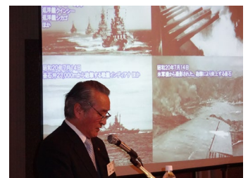
釜石市長プレゼンテーション