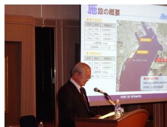
大船渡市長プレゼンテーション