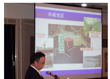
久慈市長プレゼンテーション