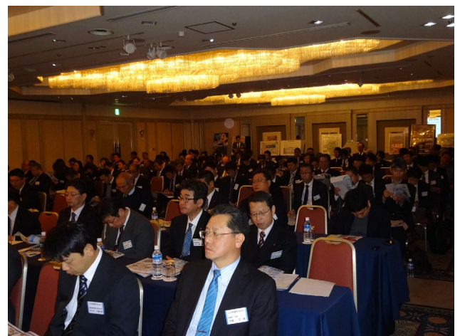
大勢の方々が出席されたセミナー会場の様子