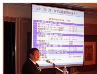
宮古市長プレゼンテーション