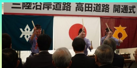
▲県立大船渡東高等学校太鼓部の皆様（左）と陸前高田市「氷上太鼓」の皆様（右）が、開式に先立ち、お祝いの「和太鼓」を披露しました