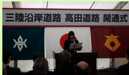
▲地元高校生による「高田道路開通への思い」発表