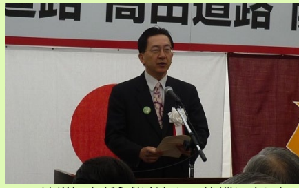
▲達増知事が主催者として挨拶しました