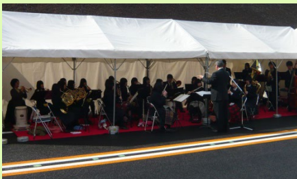
▲県立高田高等学校吹奏楽部の皆様によるお祝いの演奏が式典を盛り上げました