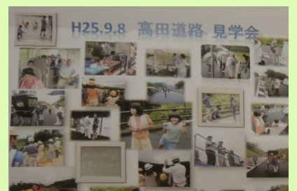
▲昨年9月8日の高田道路の見学会の様子式典会場で紹介・展示されました