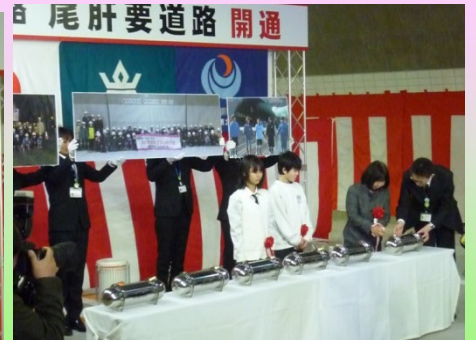
▲田野畑小学校児童が「田野畑村の未来」「未来の自分へ」について綴った思いをタイムカプセルに込めました