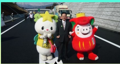
会場に到着した達増知事を出迎える陸前高田市マスコットキャラクター「たかたのゆめちゃん」と大船渡市マスコットキャラクター「おおふなトン」