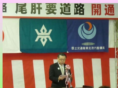
▲達増知事のあいさつを代読する千葉副知事