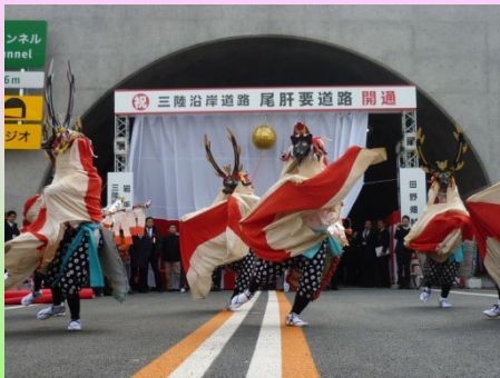
▲地元の方々による「菅窪鹿踊（すげのくぼししおどり）」が式典を盛り上げました