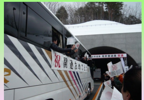
▲開通を祝して行われたパレード