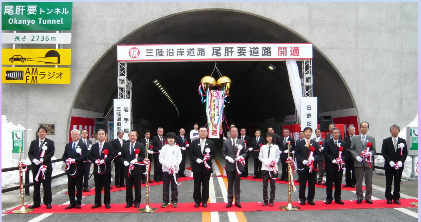
岩手県 千葉茂樹副知事(中央左)、田野畑村 石原弘村長(中央右)をはじめ、鈴木俊一衆議院議員、畑浩治衆議院議員、平野達男参議院議員、田野畑小学校児童の方々ほかご来賓の皆様によるテープカット及びくす玉開披