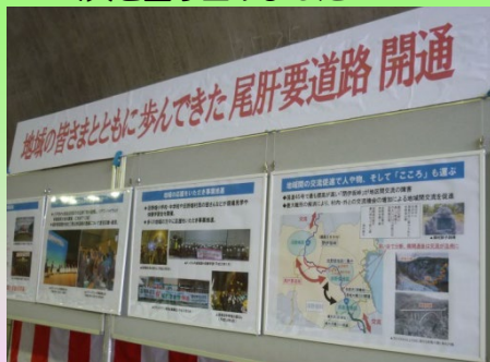
▲式典会場に掲示されたパネル 地域の皆様とともに尾肝要道路は開通の日を迎えました