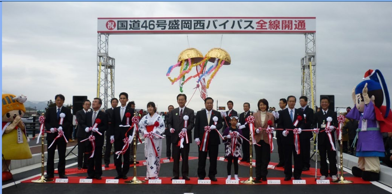
達増拓也知事、谷藤裕明盛岡市長はじめ、階猛衆議院議員、高橋ひなこ衆議院議員、主濱了参議院議員、下久根さんさ踊り保存会、都南太鼓保存会の方々ほかご来賓の皆様によるテープカット及びくす玉開披