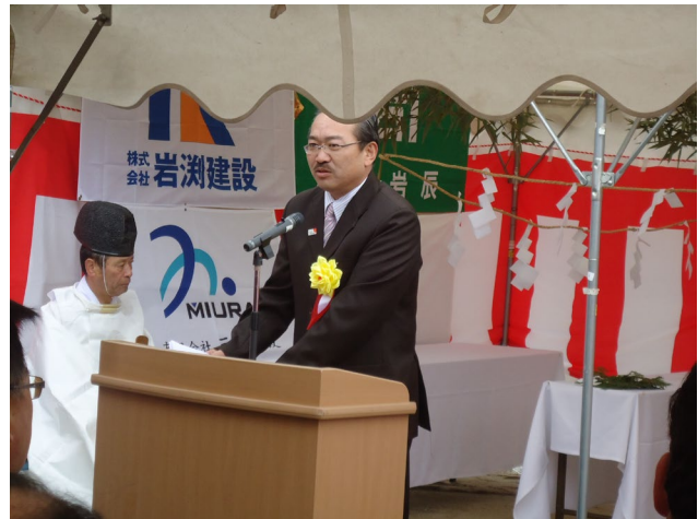
施工業者が無事故無災害を誓う 室根バイパス L=4.88km