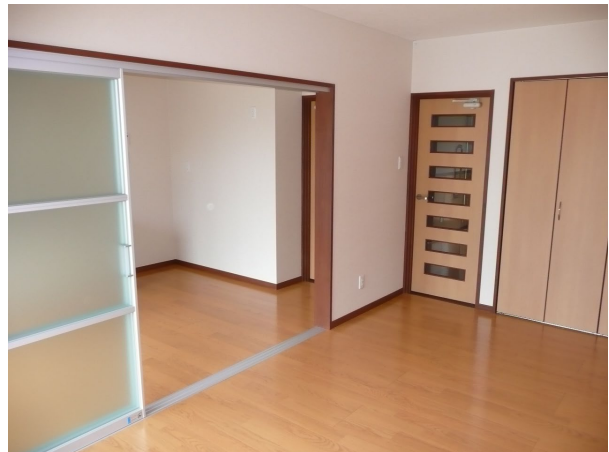
完成写真：室内（リビング及びDK）