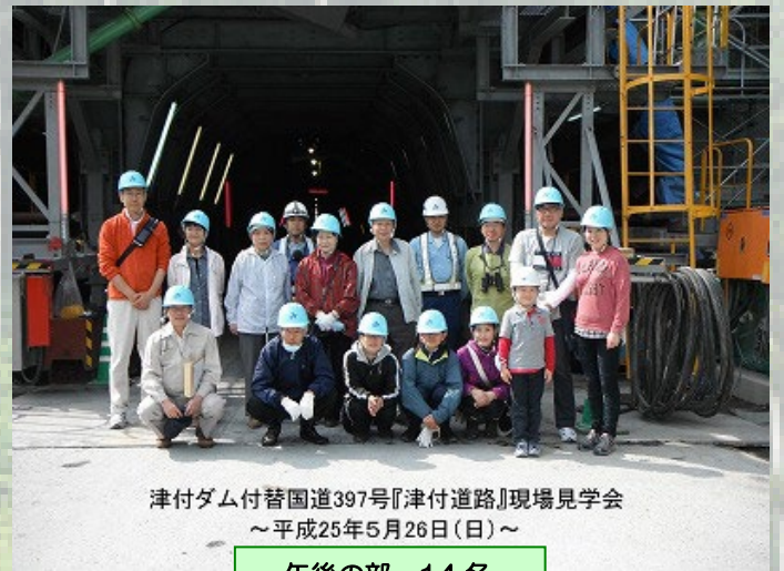
津付ダム付替国道397号「津付道路」現場見学会 ～平成25年5月26日(日)～