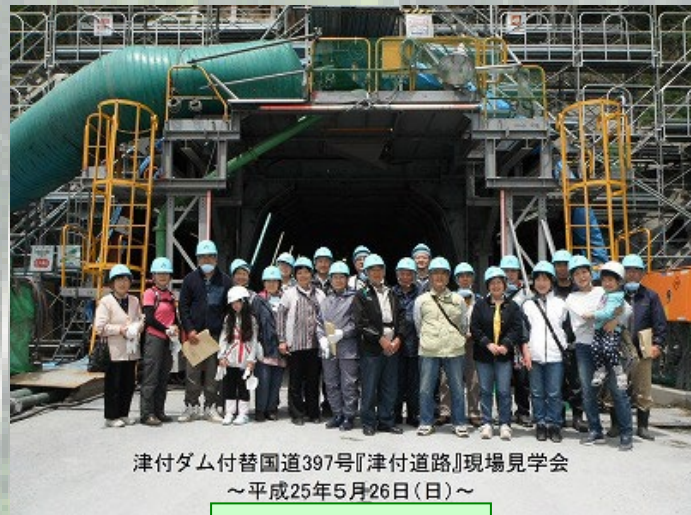
津付ダム付替国道397号「津付道路」現場見学会 ～平成25年5月26日(日)～