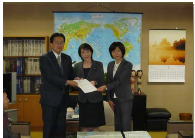
高市自民党政調会長(中)と達増知事、高橋衆議院議員