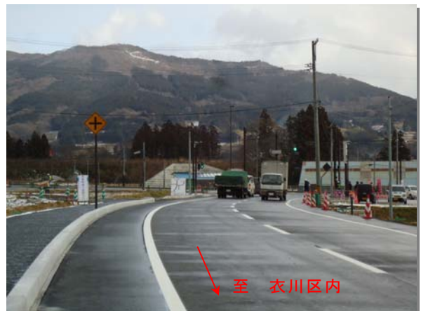
今回開通区間の状況