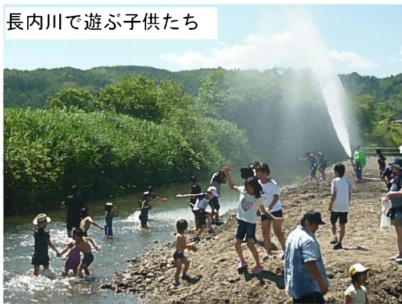
長内川で遊ぶ子供たち

長内川川の会（市民団体）と共催しており、官民がお互いの持ち味を活かしたイベントを開催しています。