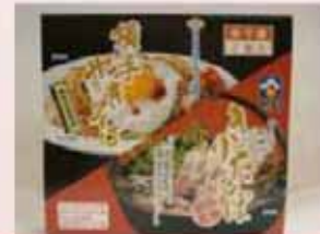
横手やきそば&きりたんぼセット