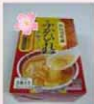
ふかひれ濃縮スープ