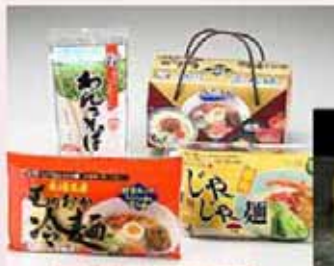
岩手三大麺セット