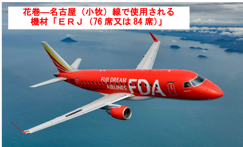
花巻一名古屋(小牧)線で使用する機材「ERJ(76席又は84席)」

花巻一名古屋(小牧)線は、FDAが昨年5月21日より開設していましたが、県内外の関係者から日帰り可能な1日2往復化への要望が県にも寄せられ、官民一体となって増便の要望活動を展開してきたところであり、今回の発表は大変うれしいニュースとなりました。