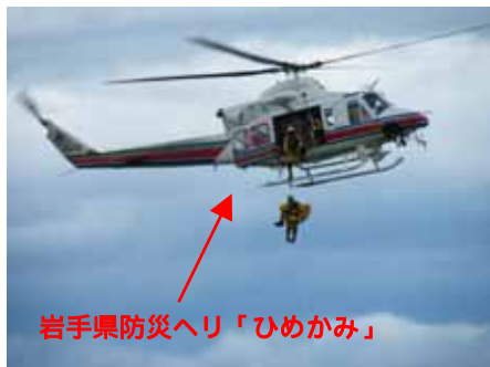
防災ヘリによる防災航空隊 救助デモンストレーション