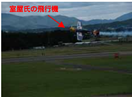
日本が誇る世界のエアロパティックスパイロット 室屋義秀氏によるアクロバット飛行

本イベントの開催などを通じて、いわて花巻空港が皆さまから親しまれ、地域とともにより一層発展する空港となるよう努めて参りますので、ご旅行・ご出張などの際には、いわて花巻空港を是非ご利用ください。