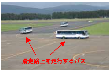
滑走路走行バスツアー (滑走路を時速100kmで走行)