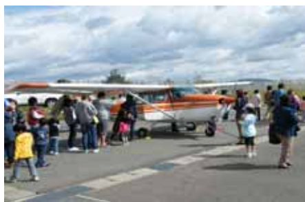
小型航空機搭乗体験コーナー (航空機を間近から見学)