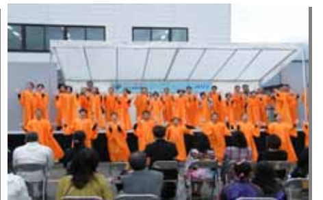
「平泉の文化遺産」PRミュージカル (ステージイベント)