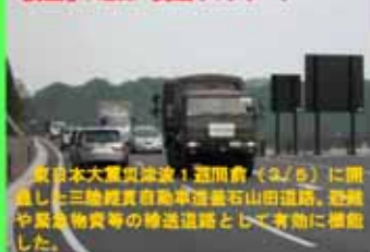
東日本大震災津波（週間倉（3/5））に閉鎖した三陸経貿自動車道並石山田道路、避難や緊急物資等の輸送道路として有効に復旧した。