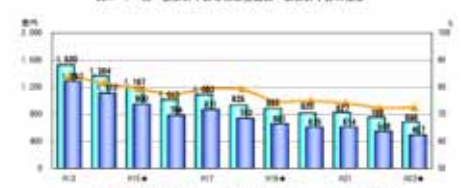
図27-2 県土整備部一般会計予算及び普通建設事業費の推移

「平成23年度 県土整備部の概要」の詳細は、こちらの県土整備部 HP をご覧ください