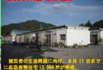
被災者の生活再建に向け、8月11日までに応急仮設住宅13,984戸が完成。