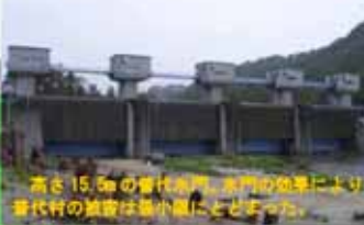
高さ15.5mの管柱式門。水門の効果により、菅代村の被害は最小限にとどまった。